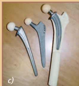
a) Röntgen-Beckenübersicht mit schwerer Hüftdysplasie vor 3-facher Beckenosteotomie b) Röntgen nach Operation mit Korrektur der Hüftdysplasie durch 3-fache Beckenosteotomie c) Langzeiterprobte Prothesenschäfte (CFP-, SP2- und Zweymüllerschäfte)

Mädchen auf, die von der Hüftdysplasie etwa fünf- bis siebenmal häufiger betroffen sind als Jungen. Oft werden die Schmerzen dann als „Wachstumsschmerz“, Zerrung oder Leistenbruch fehlgedeutet, obwohl sie bereits Vorboten einer sich entwickelnden Hüftarthrose sind.